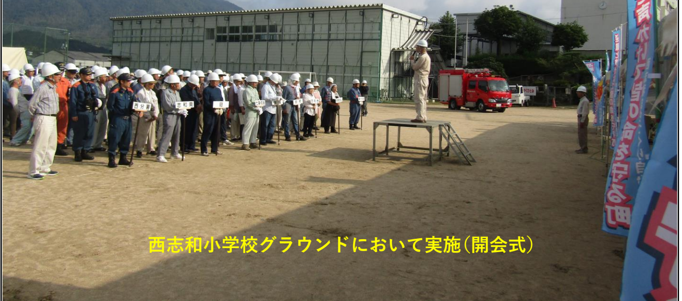
西志和小学校グラウンドにおいて実施(開会式)

8月25日(日)に第4回となる西志和自主防災会総合防災訓練が晴天の下、西志和小学校のグラウンドと体育館を会場に開催されました。