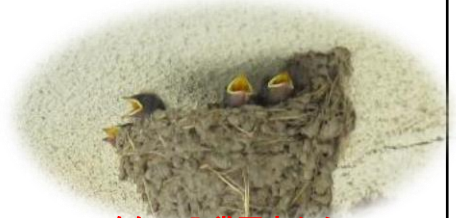
昨年の入賞写真から