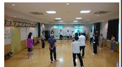
▲室内ペタンク講習会の様子

8月24日（土）西志和コミュニティハウスにて室内ペタンク講習会を開催し、約30名が参加し楽しみました。ペタンクはフランス発祥で、小さい球にボールをいかに近づけるかという一見単純ですが頭を使う楽しいスポーツで、誰でも楽しめます。