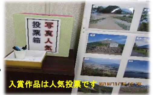
入賞作品は人気投票です