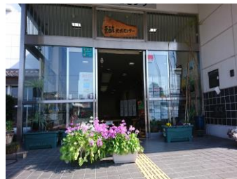
「地域センター玄関・サクラソウ」