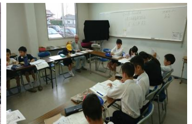
「0から学ぶ子どもの将棋」