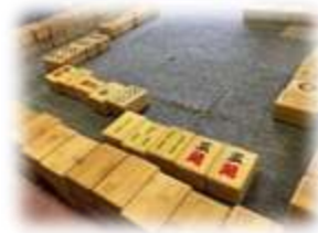
普通の麻雀より、 パイが大きくて ルールが簡単