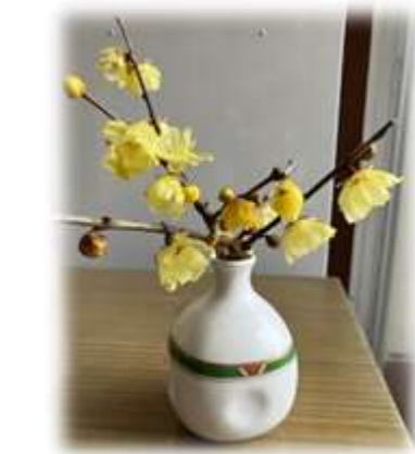
《地域センターの玄関にも春が・・・》 蟬梅(ろうばい) 地域の方からの頂もの