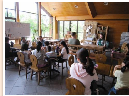
《留学生さんとの交流》