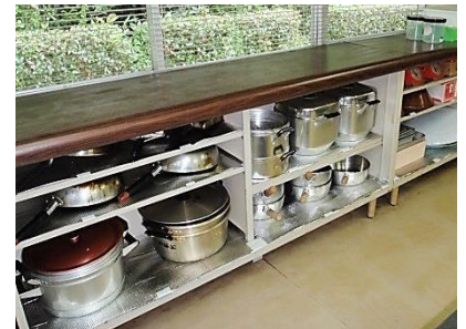
調理室の調理器具入れ棚