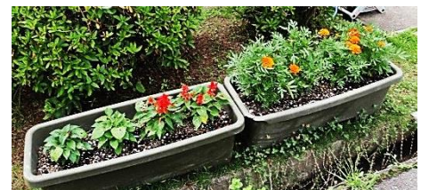
プランター 季節の花