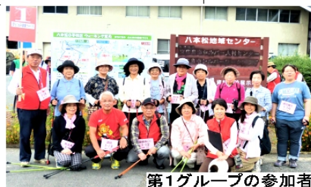
第1グループの参加者

八本松小学校区 住民自治協議会は 10月8日「まちぐ るみ健康ウォーク」 を開催した。この イベントは昨年度 から重点活動とし て取り組んできた 「まちぐるみ心と 体の健康づくり」 の成果を地域の皆 さんに紹介し、活 用していただくた めに開催されたも の。天候が心配さ れる中