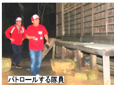
パトロールする隊員

約20名の有志と青パト6台が集結し学校区内のパトロールを行った。雨あがりのためか公園や広場には人影もなく、人気スポットで「ポケモンGO」をプレイする子どもたちは見受けられなかった。今から、秋祭りのシーズンに