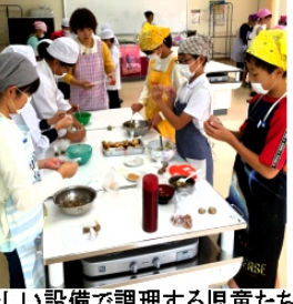
新しい設備で調理する児童たち

豆腐ドーナツは豆腐入りのドーナツで砂糖やきな粉をまがしたヘルシーな逸品。また、「みそ丸くん」はみそ汁の具と味噌、出汁等を混ぜ合わせ丸めたものでお湯をかけると味噌汁ができる家庭イONSタント食品。