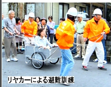
リヤカーによる避難訓練

から地域の防災訓練や研修会には積極的に参加し、防災意識を高めることが重要。ちょっとした心構えや備えが災害時に大きな差になる」と強調した。