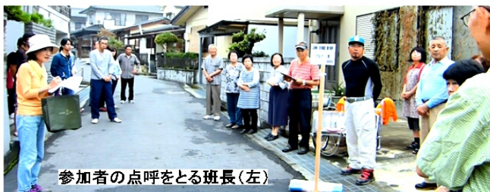
参加者の点呼をとる班長(左)