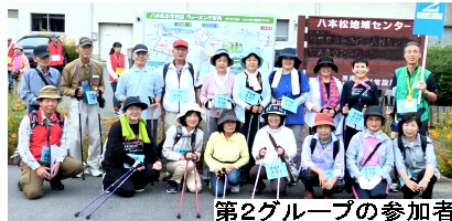
第2グループの参加者