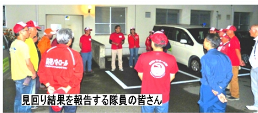
見回り結果を報告する隊員の皆さん

約20名の有志と青パト6台が集結し学校区内のパトロールを行った。雨あがりのためか公園や広場には人影もなく、人気スポットで「ポケモンGO」をプレイする子どもたちは見受けられなかった。今から、秋祭りのシーズンに