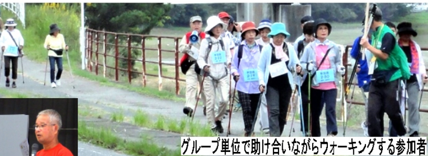
グループ単位で助け合いながらウォーキングする参加者