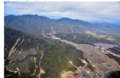
大竹地区より↑ ↓光路地区より