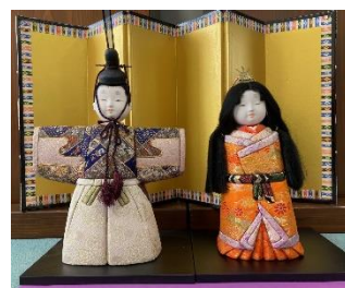
木目込み立ち雛