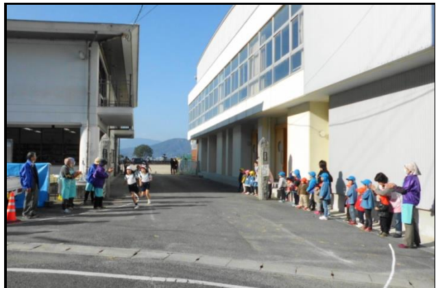
12/8 木谷小学校「持久走大会」を豚汁で応援

応援した人たちや、走り終わり屋内運動場に集合した児童たちに、地域で穫れた野菜をたっぷり使った温かい豚汁が振る舞われました。