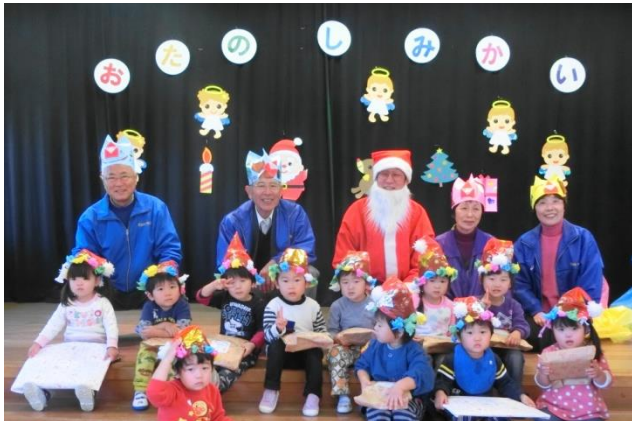
12/2 木谷保育所で「おたのしみかい」

少し早いサンタクロースの登場に園児は大喜びでした。幼児、年少、年中、年長それぞれ劇、歌を一生懸命演じ歌ってくれました。