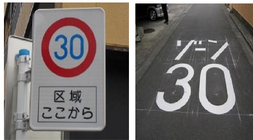
（速度規制30キロメートル / 毎時）

生活道路における歩行者等の安全な通行を確保することを目的として、安全対策を必要に応じて組み合わせ、ゾーン内における速度抑制や、抜け道として通行する行為の抑制等を図る生活道路対策です。東広島市内では黒瀬町内2地区、高屋町小谷地区、西条本町地区の4区域あります。この度西条本町地区を拡大して下さいました。