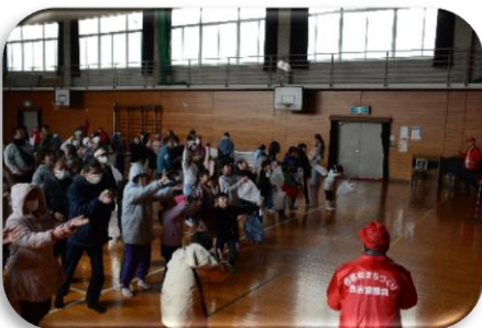
こっちにも投げて！！