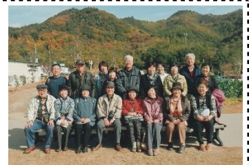
因島の万田酵素工場見学▲