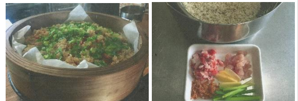
完成した中華おこわとその材料

③ フライパンにオイルをひき、餅米を炒める。焦げそうになったら水を加え、少し透き通るまで炒める。必要なだけタレを混ぜ合わせて、30分蒸す。刻んだ青菜を入れる場合は蒸し上がる直前に入れる。(コツ：餅米の美味しさを引き出すため酒みりん砂糖は使わない)