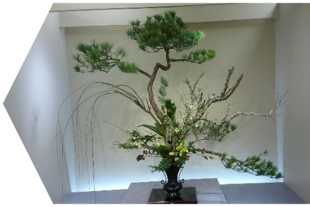
井田忠先生のお作品