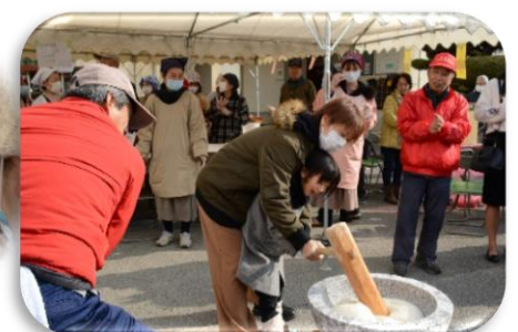
親子で楽しく餅つきしました