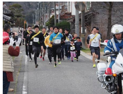
白バイの先導で走りました

親子での参加や、他地区からも大勢の参加があり、今年もにぎやかな大会となりました。