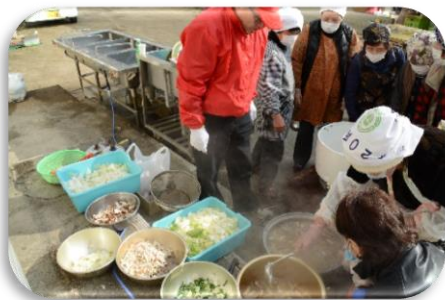
サロンの皆さんによる豚汁ときな粉餅作り

今年で第2回目となる西志和節分餅つき大会が2月2日（日）に西志和小学校で開催されました。当日は晴天にも恵まれ約120名の参加者があり、杵でついた餅や豚汁が参加者に振舞われました。その後体育館で餅と豆をまいて「餅まき大会」を楽しみました。