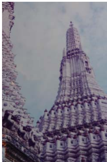
暁の寺ワットアルン

生していたがそれは煤塵とか硫黄酸化物等で地球環境（二酸化炭素）の話ではなかったが、大学の先生は地球温暖化を憂慮していた。発展途上国では、ある程度経済発展が優先かと思っていましたが、先見性のある立派な学者が沢山いることを認識。