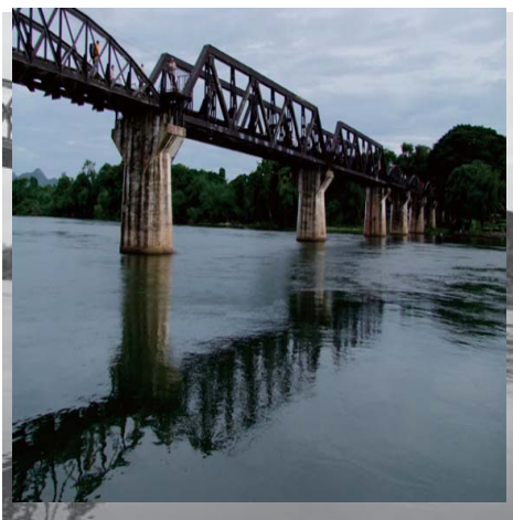
クワイ川鉄橋（修復後）

酷使し、建設したタイとミャンマー（ビルマ）を結ぶ鉄路。映画「戦場に架ける橋」でも有名。バンコクの北西110Kmのカンチャナブリ迄バスで2時間余り、クワイ河の鉄橋を見て、一部鉄道にも乗り、日本軍鉄道隊が建てた慰霊塔、連合軍側が作ったアーリントン墓地のような連合軍戦没者共同墓地、戦争博物館等を廻った。戦後修復された鉄橋には、日本のメーカー「横河橋梁」のプレートも見られた。このような日本が加害者側の施設（中国北京や盧溝橋の博物館等も同様）を、多数の外国人観光客もいる中で見るのはやはりつらい、歴史の正しい認識の為には必要か。