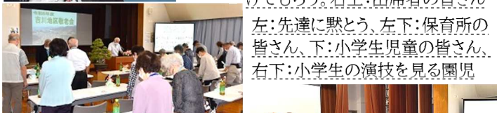
左：先達に黙とう、左下：保育所の皆さん、下：小学生児童の皆さん、右下：小学生の演技を見る園児