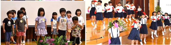
【アンダンテの皆さん】