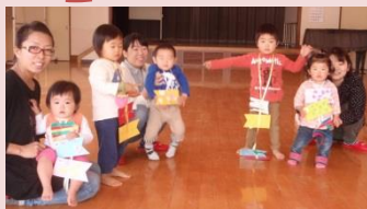
工作：こいのぼりを作りました