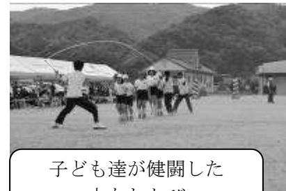
子ども達が健闘した 大なわとび