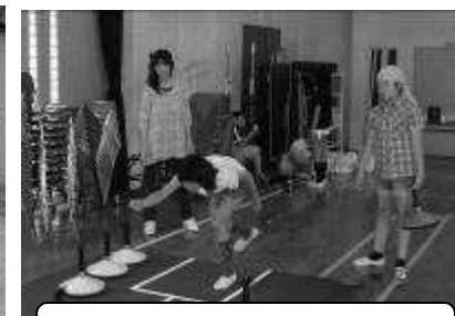
ユニカール楽しかったよ