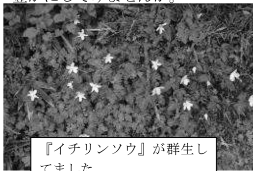
『イチリンソウ』が群生していました

普段何気なく見ていた草花、その草ひとつひとつに名前があるのをご存じですか。第1回目のウォーキングでは『イチリンソウ』『ハナイカダ』『オドリコソウ』などを図鑑で調べながら探索しました。みんなで「これ、しっとる、しっとる」「うちの家にもあるね～」などとふれあいながら楽しく参加しました。今回の参加者は14名でした。月によって咲く草は異なります。次回を楽しみにしています。みなさんも、ウォーキングで野の花を観賞して心を豊かにしてみませんか。