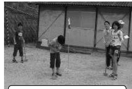
グラウンドゴルフ集中してる