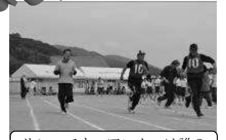
リレーです。アンカーは誰？