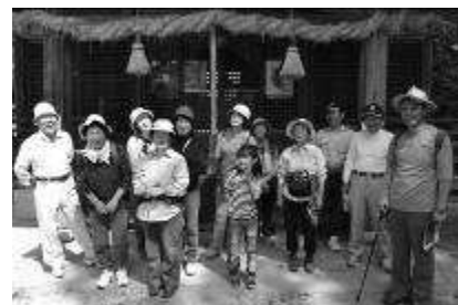
コースの途中大宮神社で記念撮影