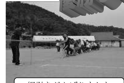
綱引きがんばりました