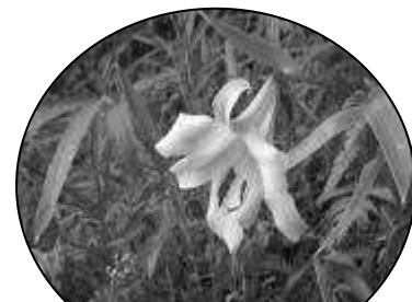
第3回(6/9)ウォーキング 今では幻の野草『ササユリ』