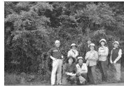
5/19 ウォーキングにて挿し穂を選定しました