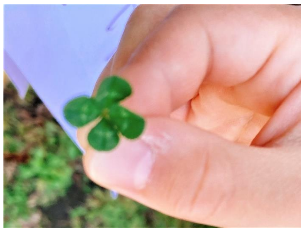
幸運を呼ぶ四つ葉

鮫洲入江広場公園はシロツメクサが多く、しかも踏みつけられる場所になっていて、比較的四つ葉のクローバが簡単に探せるスポットです。坂井市より記念品を頂戴しましたので、これをもとに、ぬりえの済んだ児童を対象にした、幸せを呼ぶクローバ探しの企画を行いました。思ったより大人も子供も夢中で、僅か45分で20枝の幸運を呼ぶ四つ葉のクローバ、4枝の金運を招く五つ葉のクローバ、1枝の地位と名声を招く六つ葉のクローバが申告され、あっという間に、イベントが終わってしまい、お土産を貰い損ねた子供まで出ましたので次回は救済策が必要かもしれません。