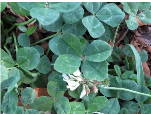
本日入江広場北側にあった四つ葉