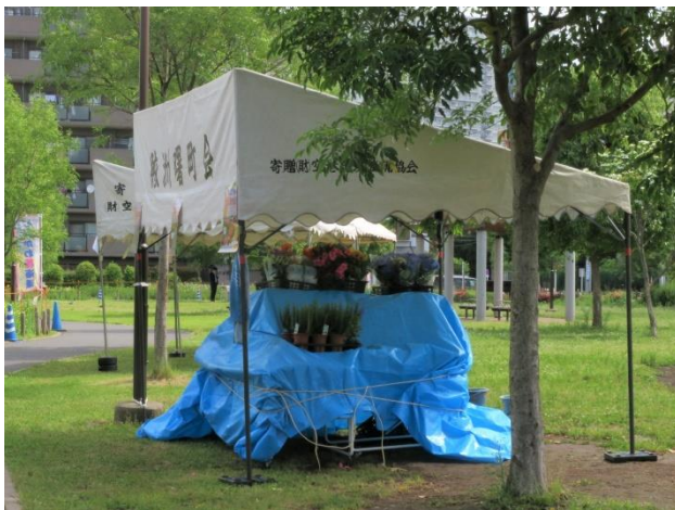
寄付を受ける前の状況