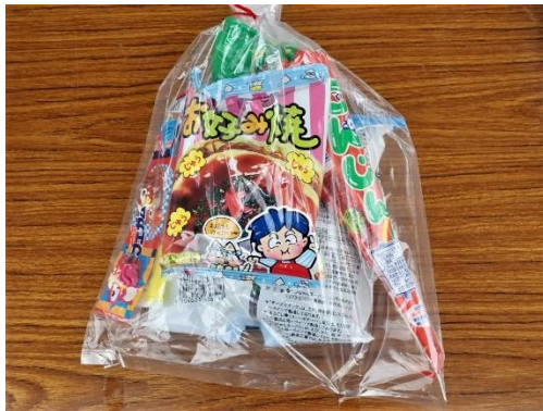
本部提供ぬりえ参加者駄菓子セット