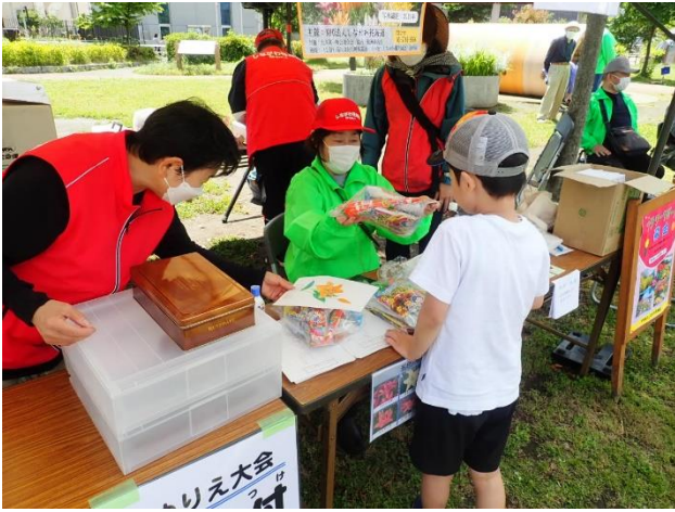
作品と景品を引き換え