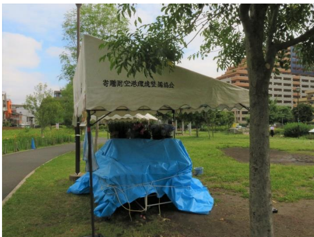
寄付を受けた後の状況