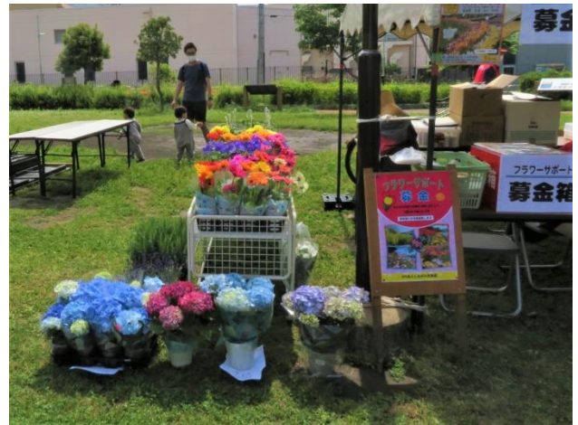
スタート時の返礼植木鉢