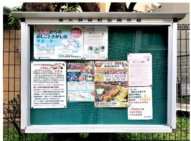
東大井林町会掲示板

大井第一地域センター、大井第一町会連合会のご協力で傘下各町会の掲示板にポスターが掲示され、近隣の方々にイベント開催の告知を行いました。また、しながわ花海道遊歩道、東大井区民集会所など、来訪者の多い所にもポスターを張り、告知しました。