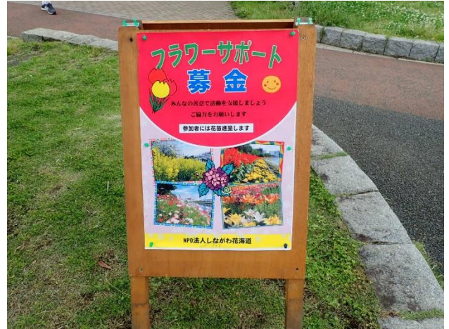
フラワーサポート募金の看板

最も人気のあったのはミニトマトで 1 時間足らずで亡くなりました。もっとも人気の無いのがリンドウで、後半一口 2 ポッドに変更しましたがやはり人気は出ませんでした。最終的に 70 口ほどの募金が集まり、採算ラインを越え目的を果たしました。