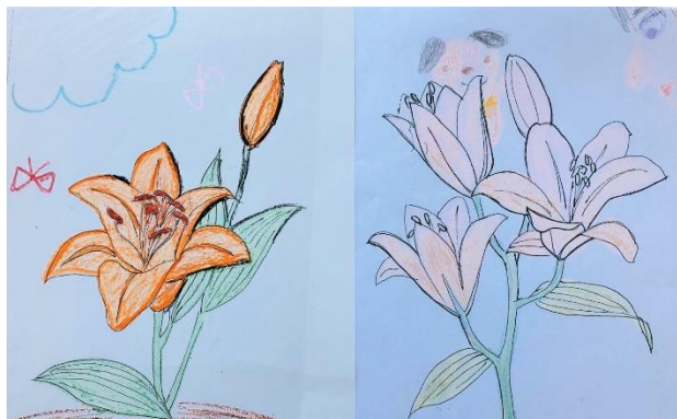
作品例 大人の作品？