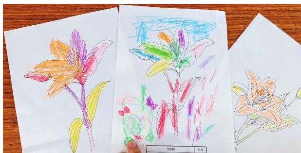
作品例 子供らしい