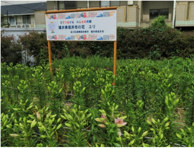
坂井市ゆり看板前の蕾が色づいてきました