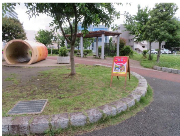
公園西南口の案内看板

8時半ごろから事務局やボランティアの手で会場設営を始めました。会場設営の後、幟・案内板設置、テーブル・椅子の組み立て配置、ぬりえ道具・鉛筆削り、ぬりえ景品、坂井市礼品の段取り準備、フラワーサポート募金の案内・朝仕入れた返礼品植栽ポッドの準備を行いました。