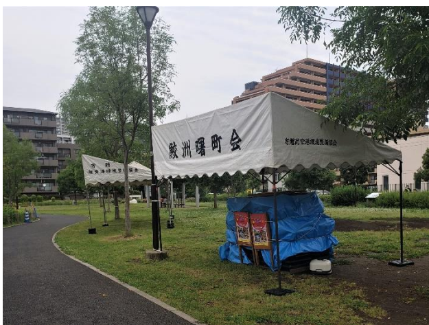
3帳のテントとブルーシート養生

午前中は少雨に見舞われる曇天でしたが、近隣町会ボランティアの協力で受付場所など3か所にテントを張りました。近隣の樹木と緊結し、関係者不在時の強風に備えました。当日使用する机や椅子は業者より借り、当日まで、ブルーシートで養生しました。