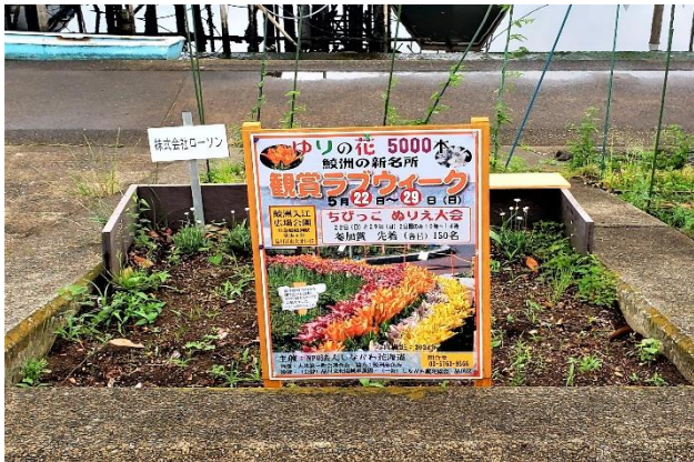
しながわ花海道遊歩道西南側花壇の掲示

午前中は少雨に見舞われる曇天でしたが、近隣町会ボランティアの協力で受付場所など3か所にテントを張りました。近隣の樹木と緊結し、関係者不在時の強風に備えました。当日使用する机や椅子は業者より借り、当日まで、ブルーシートで養生しました。