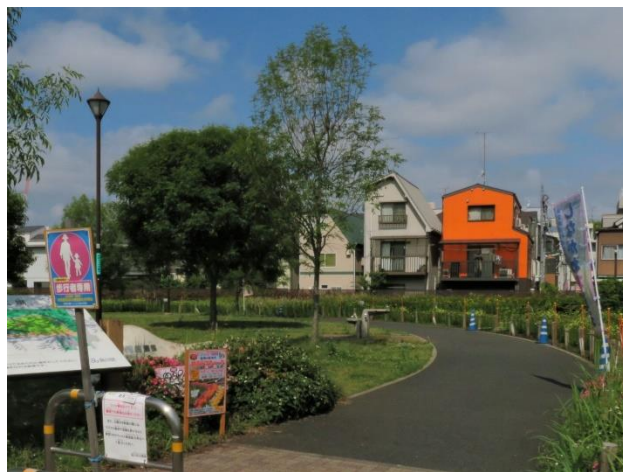
公園東北口の案内看板