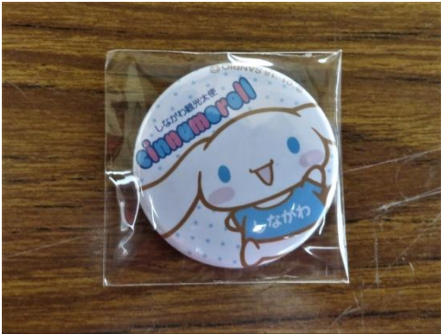
品川区提供ぬりえ参加者缶バッジ