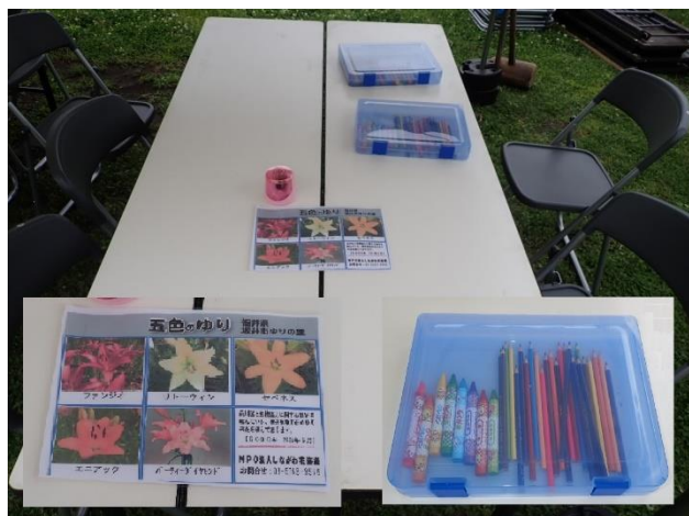
ぬりえを行う場所と道具類