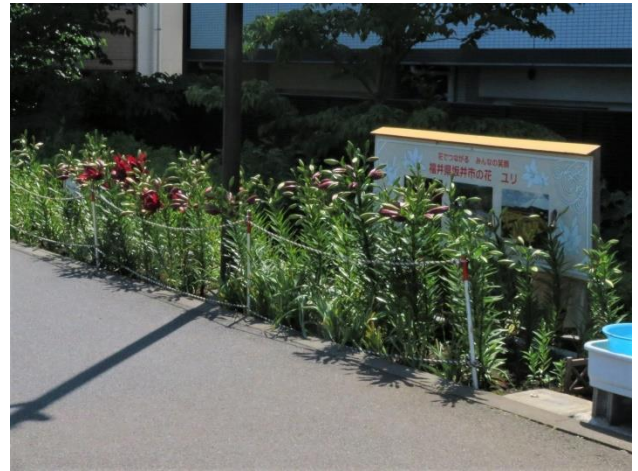
しながわ花海道西北花壇のゆり

鮫洲入江広場に隣接した、しながわ花海道西北部の最初に植えた坂井市旧看板前花壇のゆりは、二分咲き位になっており、週末には見頃を迎えられそうです。