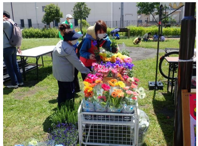
返礼用植木鉢を選ぶ募金者