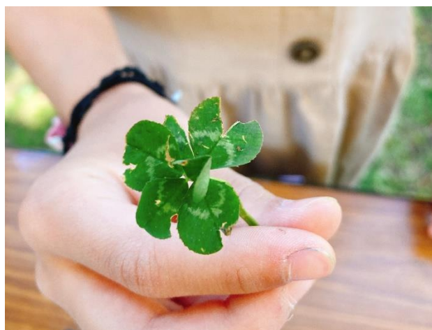
地位と名誉を呼ぶ六つ葉