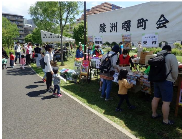
ぬりえ受付、後のテントがぬりえ作業場

引率の父兄、年配者で鑑賞や寄付だけの方が居たことを考慮すると、イベント来場は 300 名を越えていたと思われます。