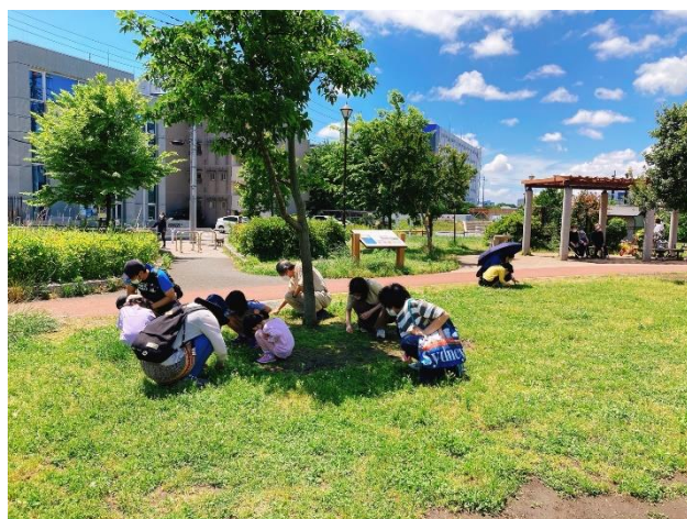
親も子も夢中です

傷が多いのが残念ですが、この場所での六つ葉のクローバ発見は初めてかもしれません。それにしても、簡単に見つけられる絶好のスポットです。