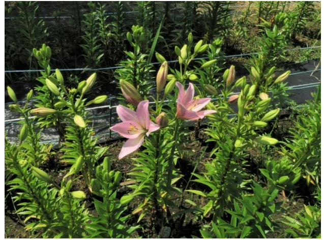
坂井市看板前近景