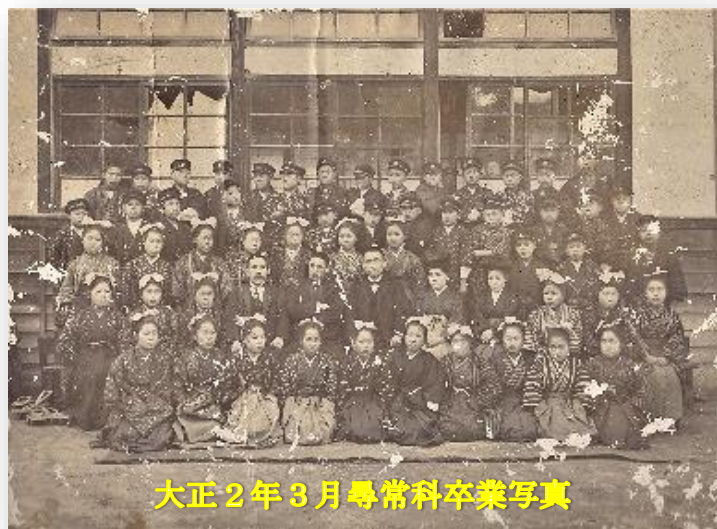
大正2年3月尋常科卒業写真