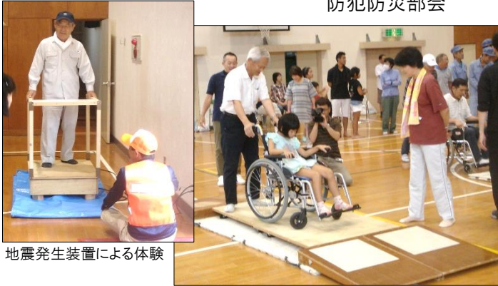
地震発生装置による体験