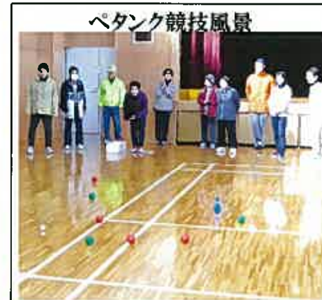
ペタンク競技風景

香典返し、お見舞い返しを you 愛 sun こうち 事務所でお受けしています。