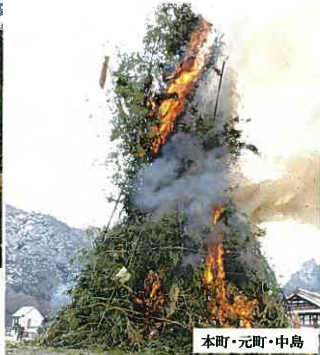
本町・元町・中島