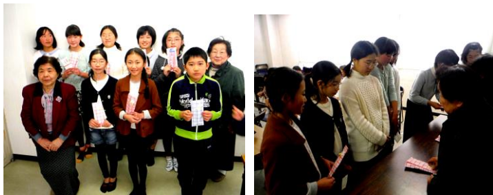
（8名の卒業生に記念品）（皆勤賞をいただく児童）

8名の6年生が卒業です！ ふるさと先生や多くの地域の方々から学んだことを忘れずに、元気のよい活発な中学生に育ってほしいですね。