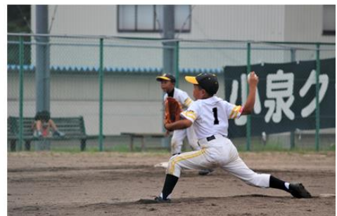
7月28日、1回戦で岐阜県代表の小泉クラブと対戦。惜しくも敗れましたが、勝敗を超えた貴重な体験となりました。