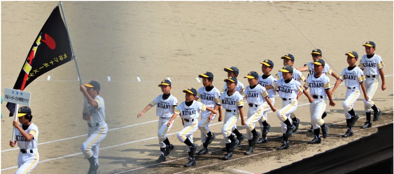
7月27日～31日の日程で行われた「第23回高野山旗全国学童軟式野球大会」に、「木谷ジャガーズ少年野球クラブ」が広島県代表として8年ぶり2回目の出場を果たしました。

元号が「平成」の期間も残り数か月となりました。新しい元号はまだ発表されていませんが、次の時代を担う子供たちは着実に育っています。木谷地域で成長する子どもたちの姿を、紙上でご紹介します。