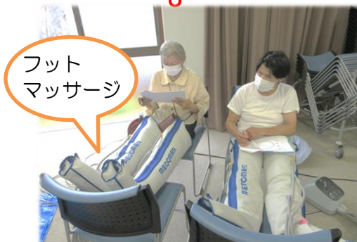
フット マッサージ