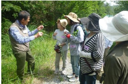
身近な里山の魅力に聞き入る

この2回の自然体験をもとに、里山イベントの企画(8月)、その試行(9月)などを行っていきます。