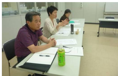
企画づくりでは活発に意見交換