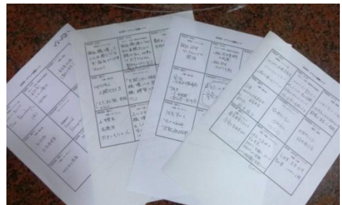
自組織の課題を解決するための オリジナル・イベントが企画された。