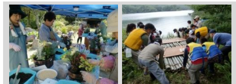
四季を通じて魅力あるイベントを実施

市の「市民協働のまちづくり活動応援補助金」などを受け、四季を通じて様々な体験イベントなどを開催し、関係者の注目を集めています。