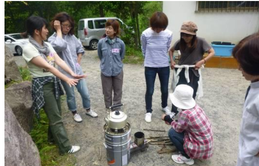
話題のエコ・ストーブで薬草茶を煎れる