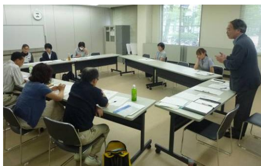
熱心に聴講する参加者

センターでは10月～11月に第2期の養成講座を開催します。また、1日コースの入門的な研修も実施したいと考えています。