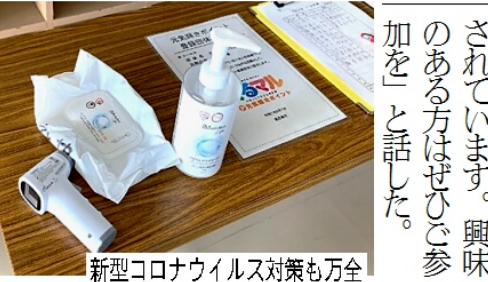
新型コロナウイルス対策も万全

「健康づくりのため、体を動かすことは大切。しかし、一人で運動を続けることは難しく、仲間となら楽しく続けられる。体操による高齢者の健康づくりとともに、お仲間との繋がりがづくりも広げてゆきたい。男性の方も参加されています。興味のある方はぜひご参加を」と話した。