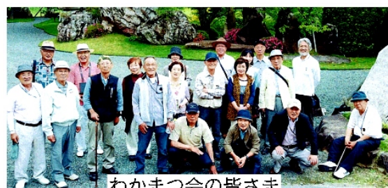
わかまつ会の皆さま

また、八本松のみ地域からは、平成31年からスタートした「近所ホットお助け隊」（日常生活支援活動）について取組のしくみや実績が紹介された。（2面に関連記事）