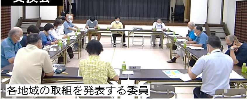
各地域の取組を発表する委員