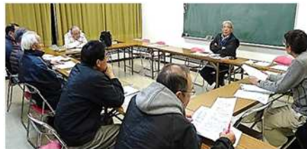
【2月18日まちづくり仮部会の模様】

判断されています。提案された意見は、プロジェクト会議・理事会で検討し、見解を付けて住民の皆様にご相談ください。に回覧します。また現在、自治協への加入届を受付けています。地域センターにご相談ください。