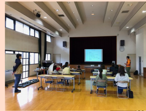
100均で揃うキャンプ道具