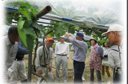
▲平原果樹園での実技講習