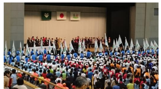
▲東広島スポーツ大会開会式