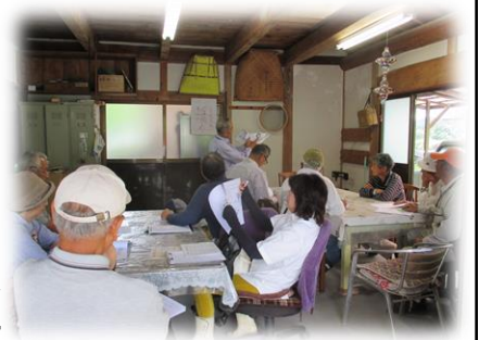
▲平原宅での栽培講習

売上金はブドウ栽培に必要な支柱や袋などの諸材料費の購入に充てたり、果樹栽培講習の費用に役立てる予定です。