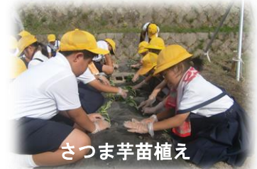
さつまいも苗植え