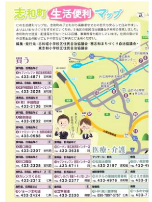
▲ 志和町生活便利マップ

高齢者を中心とした健康づくり等の推進を目的とし、活動ごとにポイントが加算されて1年間の合計ポイントで個人に報奨金が支払われる制度が10月から始まります。西志和地区の21のサロンが団体申請を行いました。サロン活動やボランティア活動の励みになればと思います。