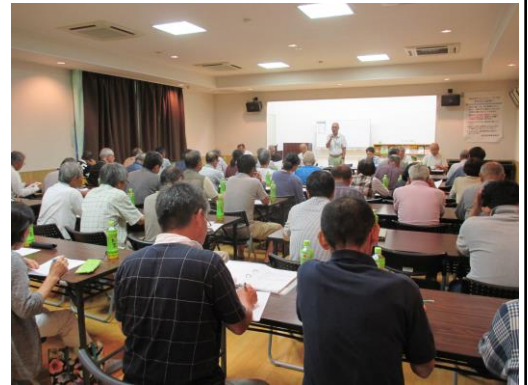
▲第1回秋まつり実行委員会

9月には第2回拡大実行委員会を開いて、秋まつりに向けての最終的な調整や決定が行われる予定です。