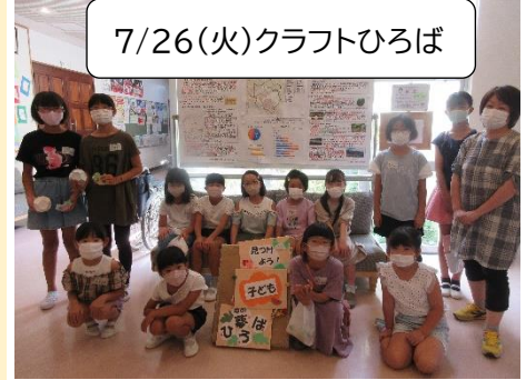
7/26(火)クラフトひろば