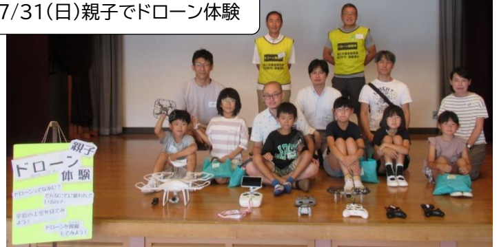
7/31(日)親子でドローン体験

地域ボランティアの方々に教えて頂きながら、素敵な夏休み体験ができ、個性たっぷりの作品が出来ました☆