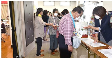
【参加者が集まる受付の様様】

最初に主催者自治協を代表して村舎会長が挨拶。吉川地域の高齢化の現状を紹介した後「サークル活動が活発に行われており、足を運んで仲間入りも考えていきましょう」と、地域と共に過ごしていけるよう今後も取り組むことを述べました。続いて