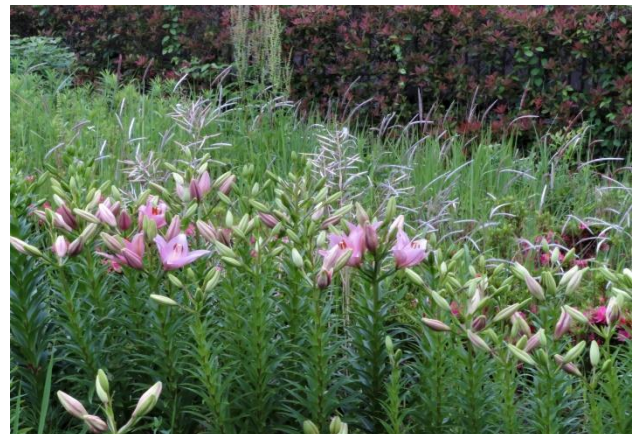
坂井市看板前近景

さわやかな風が吹く晴天でした。連日の好天でユリ花壇の開花も順調で、午前中の段階で昨日の 3 倍・100 枝弱のゆりが開花しました。これまでピンク一色でしたが濃い赤も咲きはじめ、華やかさが増しました。たまたま、屋外活動で移動中に通った鮫浜小学校児童の目を楽しませました。