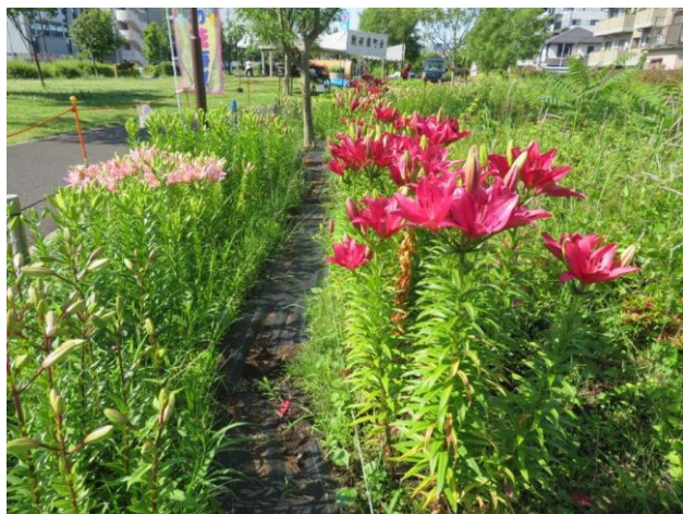
ピンクと赤のレインボーラインです

先週のような5輪だけの開花とはうって変わり三分咲き程度になりました。昨日1000花でしたから2000花以上になっているでしょう。午前午後でも随分違います。開花しているのはピンクのパーティーダイヤモンドと赤のファンジオとやっと咲いた数花の黄花だけで、白とオレンジは未開花です。