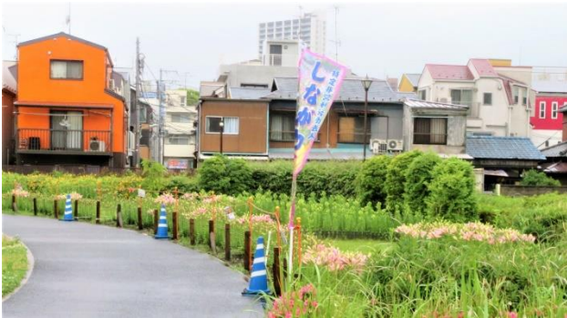
北側オリパラ花壇全景