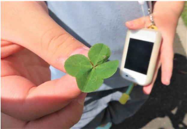
幸運を呼ぶ綺麗な形の四つ葉のクローバ (これを含め 50 枚採集されました)