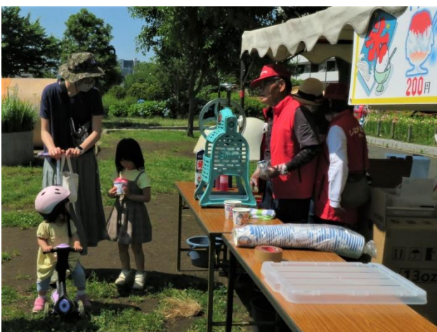
かき氷三種、一杯 200円

先週日曜日に開幕した鑑賞ラブウィークですが、早くも8日も過ぎ、最終日を迎えました。最終日は今年初めての真夏日にな