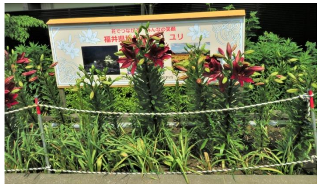
しながわ花海道北西花壇のゆり