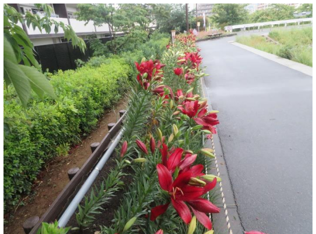
しながわ花海道西北遊歩道の開花状況