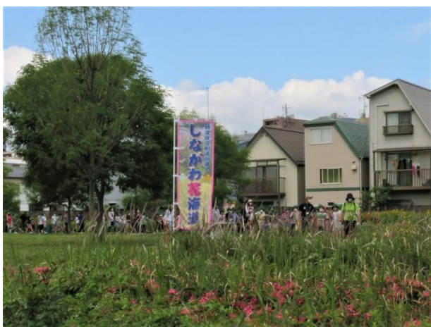
ゆりを見ながら移動する鮫浜小学校児童達