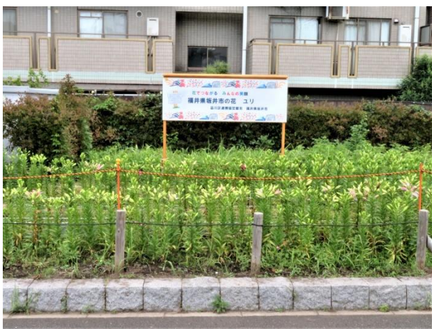
坂井市看板前遠景