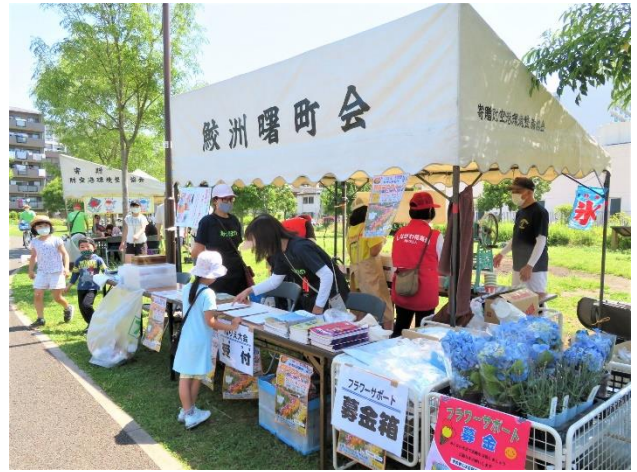
受付には次々とぬり絵希望者が来場

ぬり絵は、先週来場者にロコミ参加者が加わり 170 枚近くになりました。途中で用紙が不足し追加コピーし、最終的に 170 枚位、完成し、景品と交換しました。