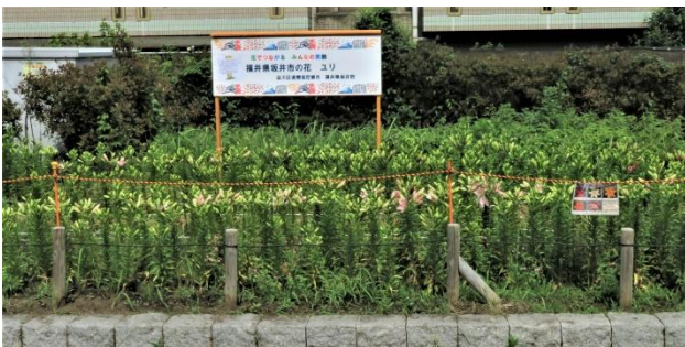
坂井市看板前遠景

花海道北側にある坂井市寄贈のゆり花壇は鮫洲入江広場公園ユリ花壇より早く咲きはじめ三ないし四分咲きです。