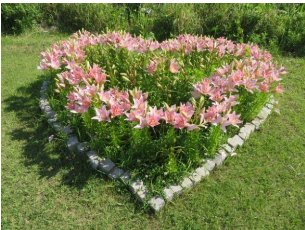
ハート花壇だけは五分咲きです