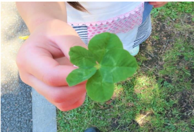
綺麗な形の金運を呼ぶ五つ葉のクローバ (これを含め 4 枚採集されました)