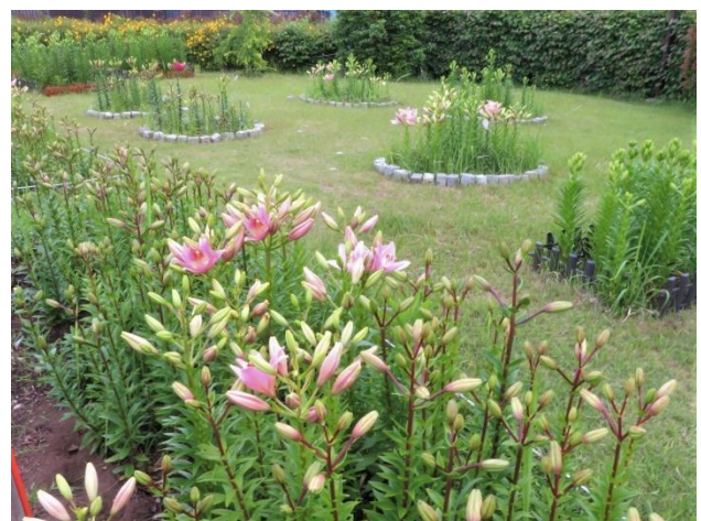
北側パラリンピック花壇遠景