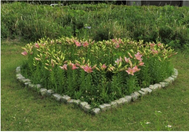
ハート花壇のパーティーダイヤモンド