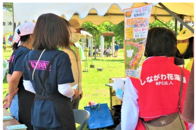
開場ミーティング