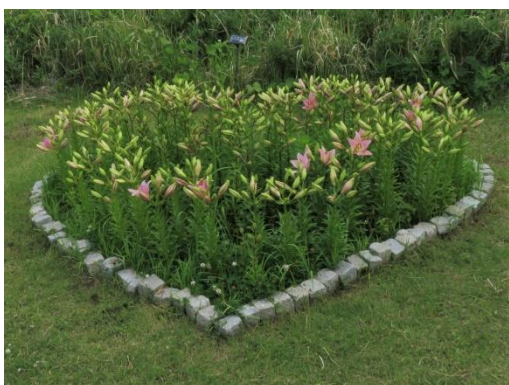
ハート花壇 心形が見えてきました