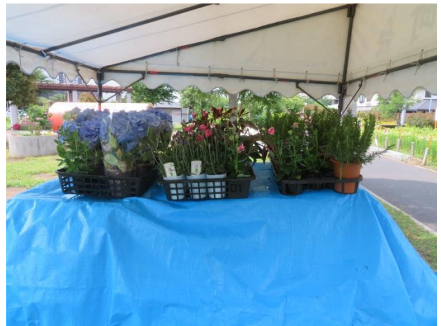
テント内保管ポッド

募金返礼用植木は、持ち去られることもなくテント内に保管されています。やや水不足気味で元気がないので散水しました。