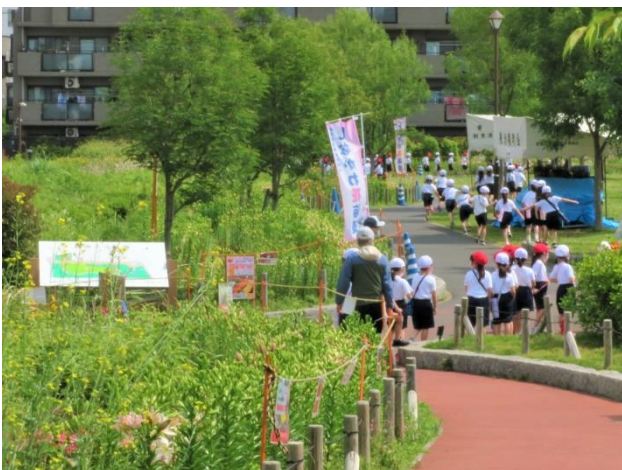
ユリを見ながら移動する鮫浜小学校低学年

花海道北側にある坂井市寄贈のゆり花壇は鮫洲入江広場公園ユリ花壇より早く咲きはじめ三ないし四分咲きです。