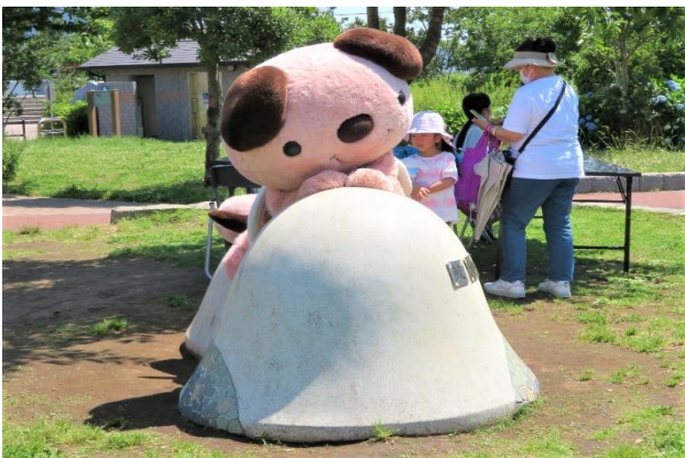
公園でご要望に応じてポージング