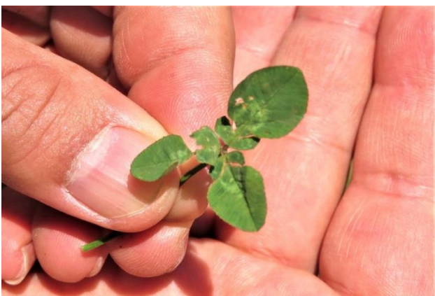
地位と名誉を呼ぶ六つ葉のクローバ (通常と異なり三つ葉が二段に重なっています)