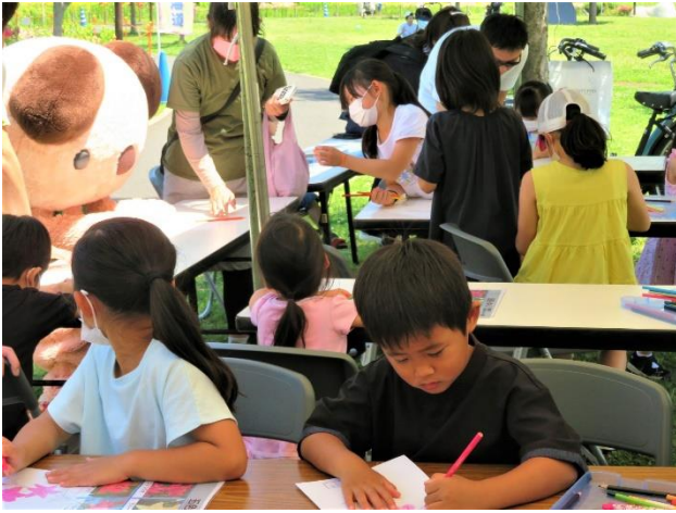
皆さんに混じり むり絵体験しました