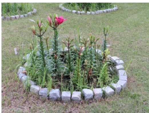
五輪花壇 赤が初めて咲きました