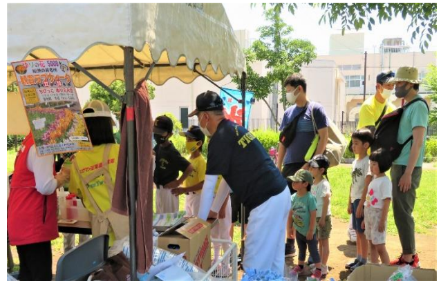
野球少年たちもかき氷に夢中です