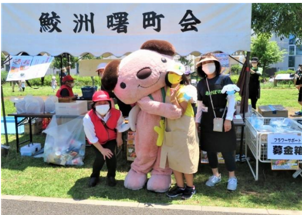
受付職員と記念撮影