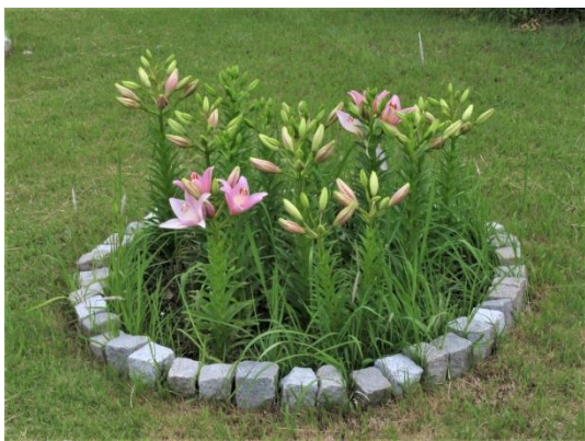
五輪花壇 華やかになってきました