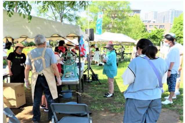
やっぱり夏はかき氷