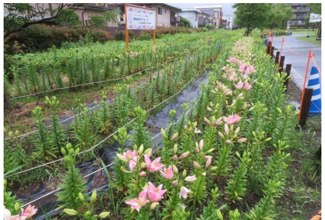
以上すべて鮫洲入江広場の開花状況