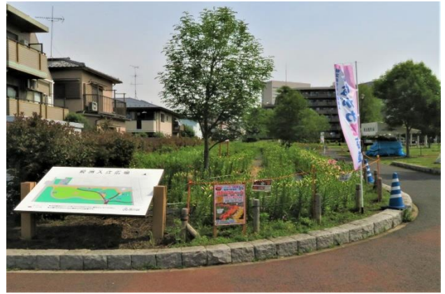
鮫洲入江広場公園東南口からの遠景