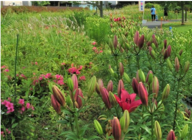
赤いファンジオも咲きはじめました

募金返礼用植木は、持ち去られることもなくテント内に保管されています。やや水不足気味で元気がないので散水しました。