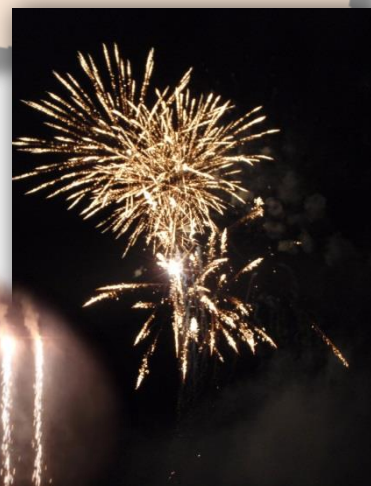
見事な仕掛け花火