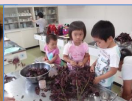
シソジュースづくり