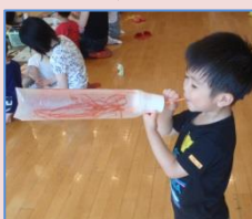
ストローを吹くと...