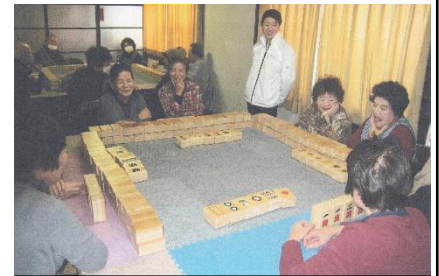
コミュニティ麻雀風景

まちづくりの一環として、一人暮らしや夫婦の高齢者を中心に呼びかけをし、17人の皆さんが集い、昨年の12月28日に立ち上げました。昨年度はコミュニティ麻雀等を実施し、今年度は卓球、ボーリング、社会見学、料理教室、しめ縄づくり、餅つき等実施予定で、地域の皆様との係わりを大切に温もりあるサロンにしたいと思っています。