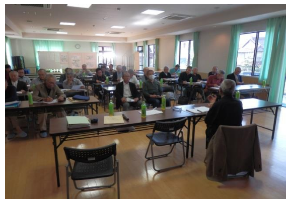
地域づくり・防災防犯合同部会（4.23）