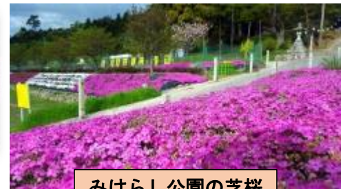
みはらし公園の芝桜