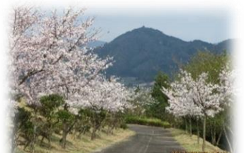
園芸センターさくら並木