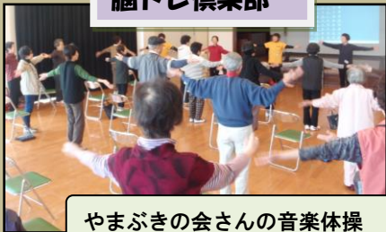
やまぶきの会さんの音楽体操