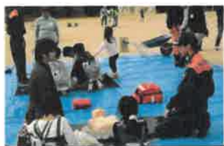
心肺蘇生方法の実演

[協賛団体名]・平岩小学校・広賀園・東広島市危機管理課・自立支援協議会 ・東広島市社会福祉協議会・水道局・消防署・井上県防犯士