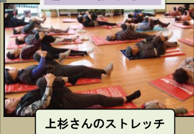
上杉さんのストレッチ