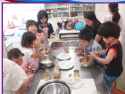
フルーツポンチ作り