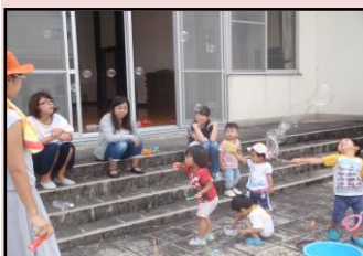
大好きなシャボン玉遊び