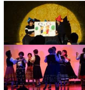
地域の練習成果を披露

学校の園児児童の作品も展示されました。展示作品数も昨年より増え展示スペースも拡大しました。