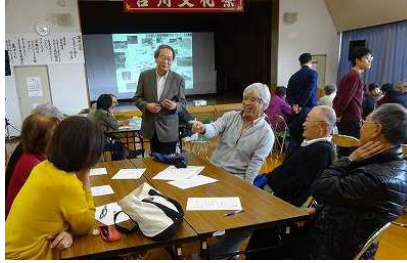
【グループワークでの話し合い】

午前9時から体育館で、出展者さん等30名を集め開会式を行い、文化祭のスタートを切りました。