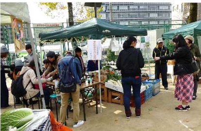
【保護者の方が特認校制度を紹介】

午前中には、各エリアの作業も終わり解散しました。今年度の作業は終了しましたが、次年度以降も県道美化活動を続けていくこととしています。道の里親ボランティアは、各地区区長・自治会長、地区推進委員、農区長、理事会推進委員、理事会役員を会員メンバーとして活動しています。【写真は、作業前ミーティング】