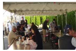
地元野菜や果物等も販売

するか」について、参加者40名が住まいの7つの地域に分かれて話し合いをしました。