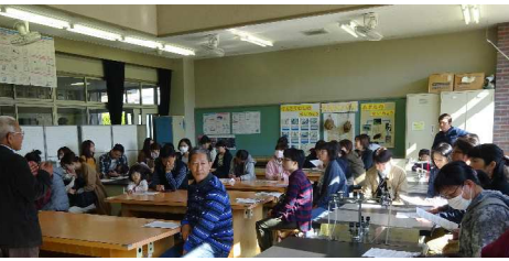
【小学校保護者の皆さんとの意見交換会模様】

発行者:吉川まちづくり自治協議会 ☎082-429-1879(吉川地域センター内) yoshikawajitikyo@outlook.jp