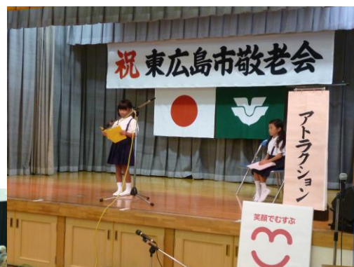
昨年の敬老会の様子