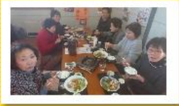
牡蠣フライ定食に舌鼓。