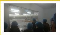
麹室も見学できました。半袖で作業されていました。