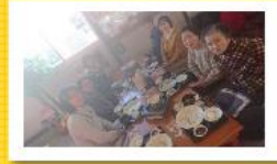
受講生の皆さん、寒い中大変お疲れ様でした。有難うございました！