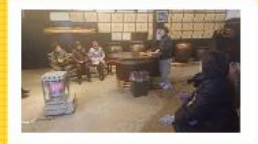
白牡丹では、吟醸酒や二級酒の造り方や味わいの方などを詳しく説明して頂きました。