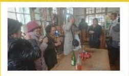
試飲タイム。皆さんいそいそと笑顔がこぼれていました。