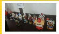
賀茂鶴の展示室。古い貴重な酒とっくりも展示されています。