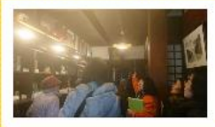
賀茂鶴の売店には、大正時代のポートワインのポスターがあります。日本に4枚しか残っていない貴重なものです。