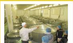
賀茂泉の心臓部にも潜入させていただきました。出来立てのお酒の香りが立ち込めています。