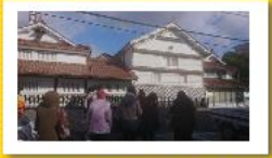
ボランティアガイドさんの説明を熱心に聴きながら、酒蔵通りを歩く受講生。