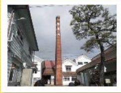
福美人の煙突。酒蔵通りのシンボルタワーです。