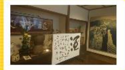
賀茂泉酒蔵の格調高い玄関。