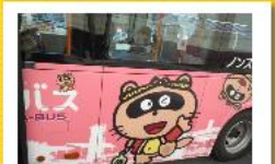
のん太のイラストでお馴染みのピンクののんバスで、いざ出発！