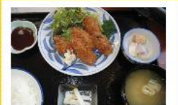
見学の最後は、酒処「樽」で昼食です。安芸津産の牡蠣のフライは絶品です。