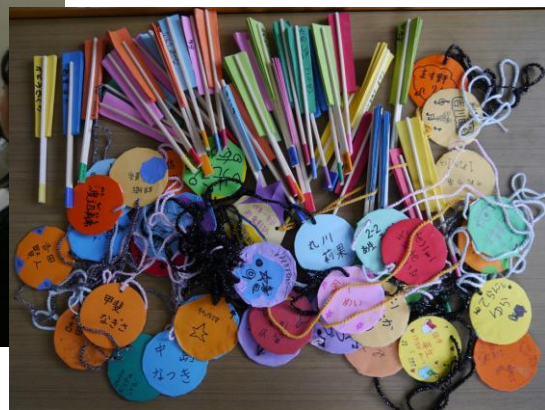
1年生には少し難しかったかもしれませんが個性的な名札と扇子ができました。