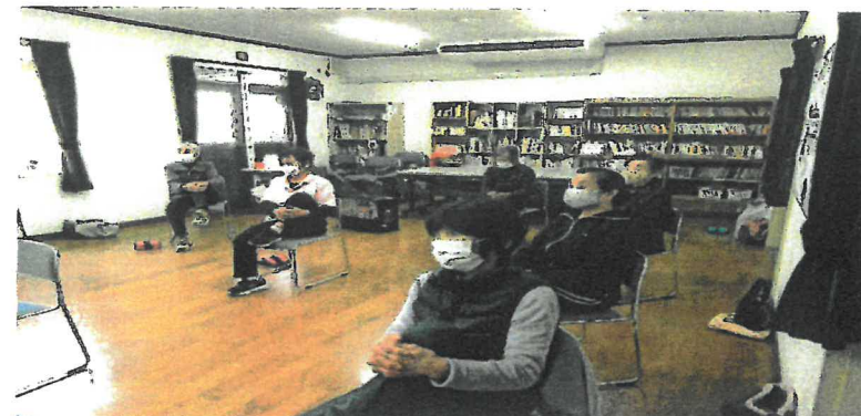
◀「いきいき百歳体操」の様子▶