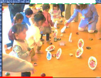
ヒライ和 子育てママさん集まれ