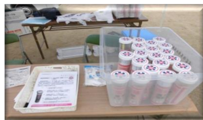
命の宝箱（防災フェスティバルにて）

その他にも、平岩放課後子供教室の実施など行っています。活動に協力していただいた方々ありがとうございます。また、お手伝いされたい方がおられましたらお声がけください。これからも、生活・福祉部会の活動にご協力、参加をよろしくお願い申し上げます。