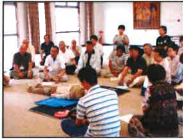
【受講者のみなさん】