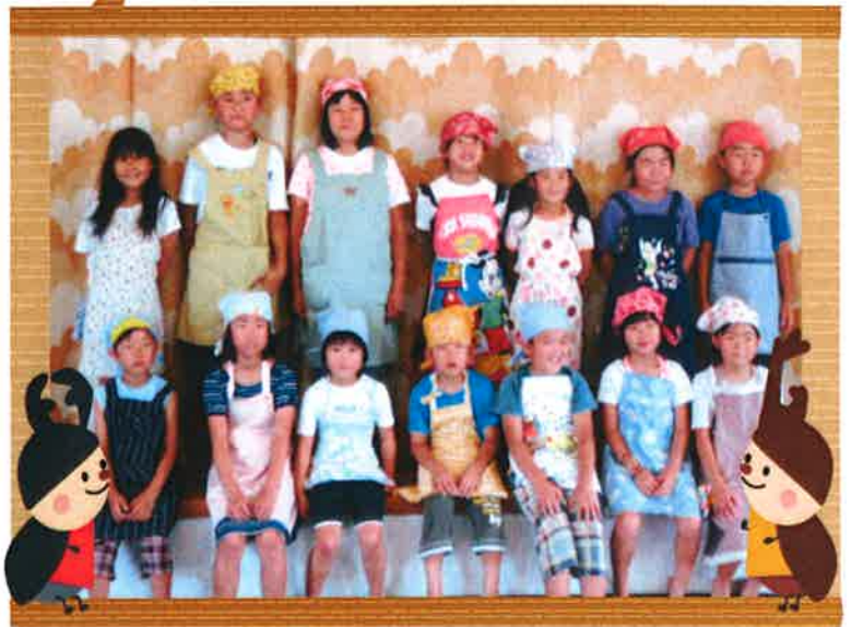
【夕食作り体験講座に参加した子どもたち】

海の日7月16日(月)『きて!みて!おもしろ体験講座』を開催しました。今回のテーマは「夕食作りにチャレンジしよう!」で14人の子どもたちが参加してくれました。今回は低学年の子どもたちが多く、「ちょっと無理かな?」と思ったけど高学年の子どもたちがちゃんとリーダーシップをとってくれました。メニューは、煮込みハンバーグ・ポテトサラダ・人参のグラッセ・目玉焼き・スパゲティ・わかめスープ・フルーツヨーグルトサラダとボリュームたっぷりでした。(ちょっと忙しかっただけ)