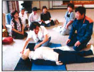
【受講者も心肺蘇生法とAEDの使用方法を体験しました】