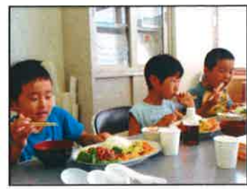
【ちょっとボリュームあり過ぎたかな?】