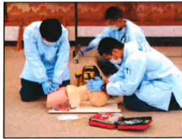
【消防署員の救急活動の実演】