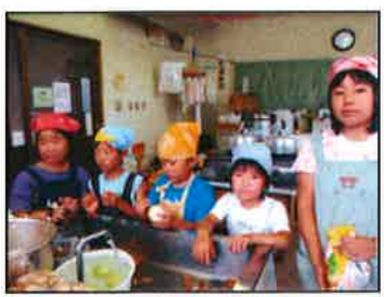
【煮込みハンバーグ担当です】