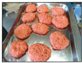
【これから煮込みます】