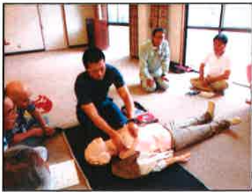
【消防署員の模範実演】