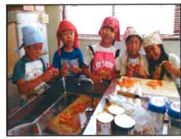
【スープ・サラダほか担当です】