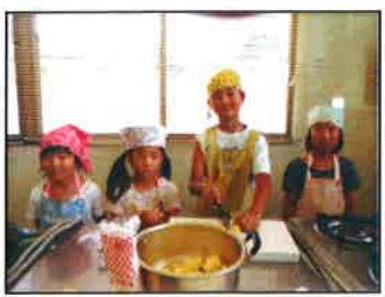
【ポテトサラダ担当です】