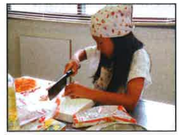
【包丁も上手に使えました】