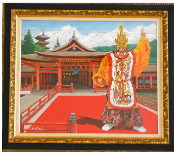
木谷地域センターの一階に飾ってある「巖島」 (60号)。平成28年寄贈。