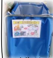
古着回収ボックス